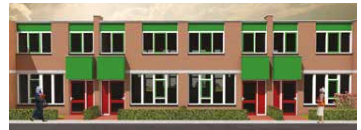
Oude situatie Naaldwijksestraat, met felle kleuren en gesloten geveldelen. Beelden oud en nieuw: Vanschagen Architecten.