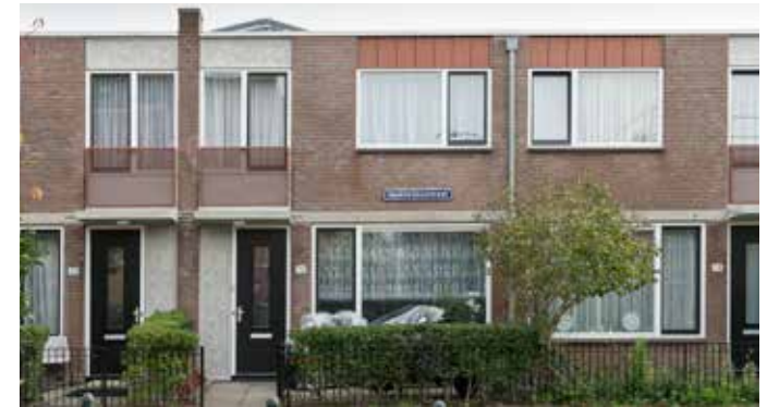
Renovatie Naaldwijksestraat Den Haag met unieke Mussenpanelen.