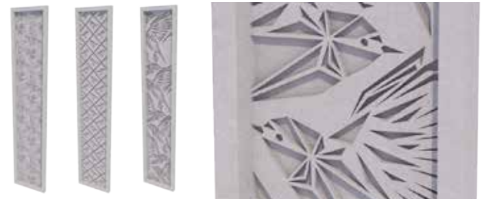
Voorstellen voor het patroon in de panelen, rechts het gekozen patroon. Beeld: Vanschagen Architecten.