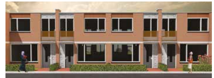
Nieuw ontwerp Naaldwijksestraat: meer openheid, verschillende materialen en rustige kleuren.